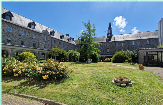
EHPAD Saint Jean Eudes à Saint-Brieuc

Les travaux démarrent le mois prochain. Nous avons hâte d'y déployer l'activité et d'offrir un cadre de soins plus adapté aux besoins des patients et des professionnels !