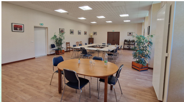
Futur lieu de soin

L'activité a été déplacée dans les locaux vacants du Centre d'Accueil Thérapeutique à Temps Partiel Ker Vor, à Langueux. Cependant, ces locaux ne répondent pas aux exigences techniques nécessaires pour le bon développement de l'activité psychiatrique pour les personnes âgées en Hôpital de Jour.