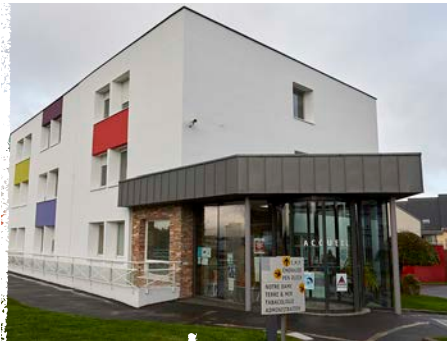
Accueil Site de Saint-Brieuc

Le service Accueil - Admission est à votre service pour toute information relative aux formalités administratives, il vous accueille sur les sites de Dinan et de Saint-Brieuc.