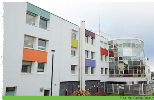
Site de Saint-Brieuc

Les patients sont admis en journée, voire la nuit en cas d'urgence. A défaut, l'établissement met tout en œuvre pour favoriser l'admission dans un autre établissement.